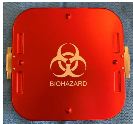
Simbolo BIOHAZARD marcato direttamente a laser sul copricoperchio

Il copricoperchio BIOHAZARD può essere applicato sullo stesso contenitore utilizzato per la sterilizzazione, se impiegato anche per il trasporto e la decontaminazione (p.e. con schiuma o spray) dei dispositivi medici potenzialmente contaminati, dopo il loro utilizzo in sala operatoria. In questo modo il contenitore è immediatamente identificato e classificato dagli operatori. I modelli di container CBM a cui può essere abbinato il copricoperchio BIOHAZARD sono: FILTRO (fondo non perforato), EVO e VALVOLE PROTETTE.